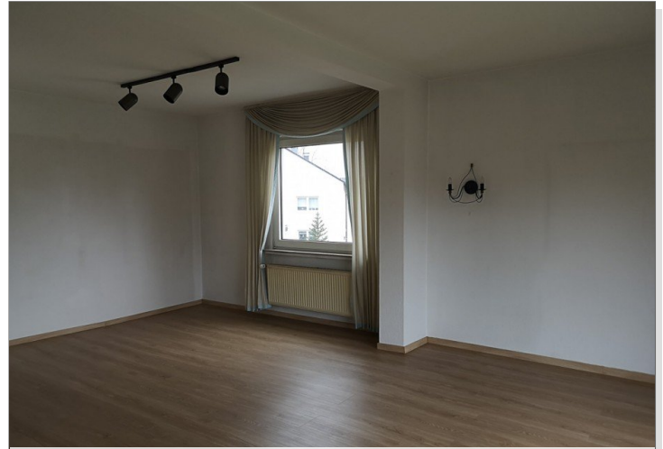
04 Wohn Esszimmer 1