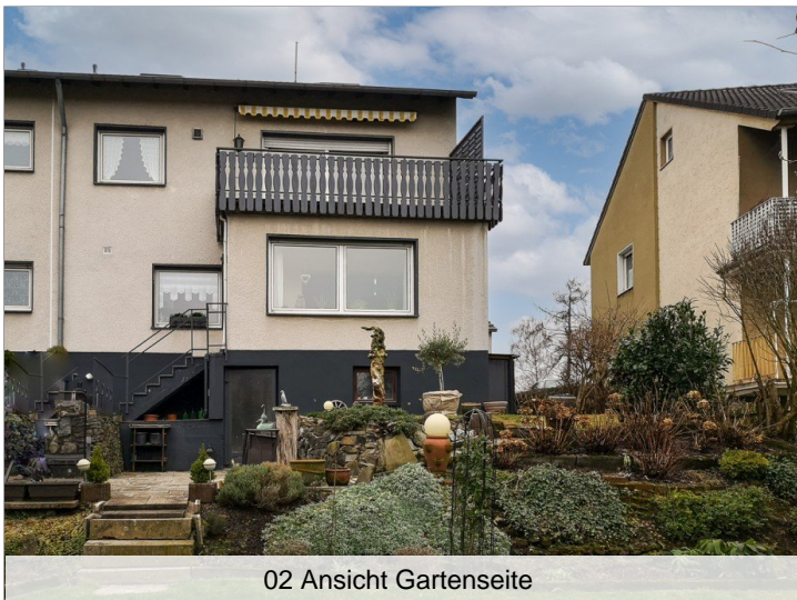
02 Ansicht Gartenseite