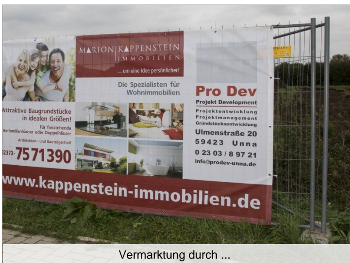
Vermarktung durch ...