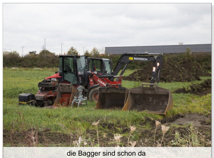
die Bagger sind schon da