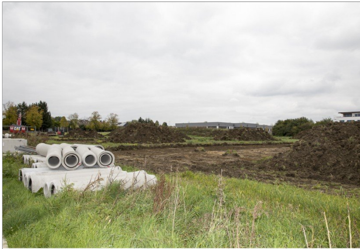
die ersten Rohre für die Kanalisation