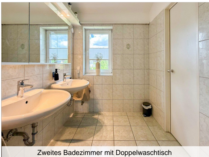
Zweites Badezimmer mit Doppelwaschtisch