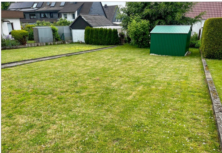
Ansicht von rechts