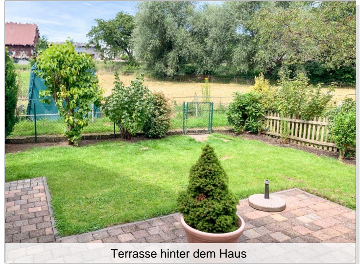
Terrasse hinter dem Haus