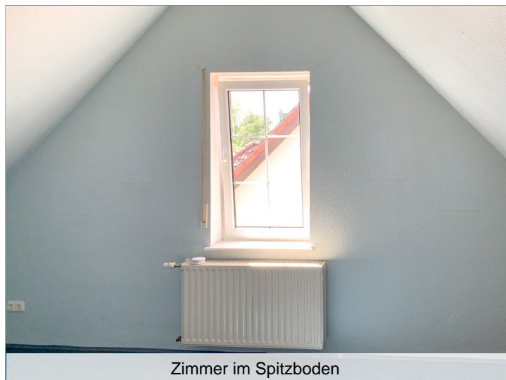
Zimmer im Spitzboden