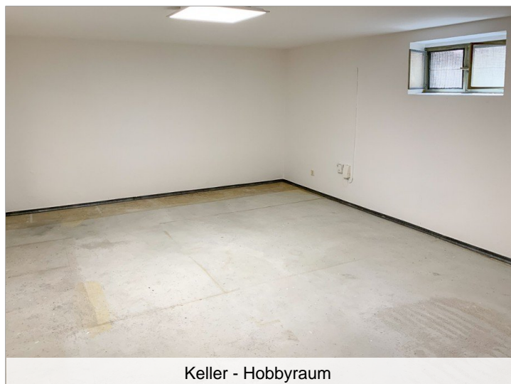
Keller - Hobbyraum