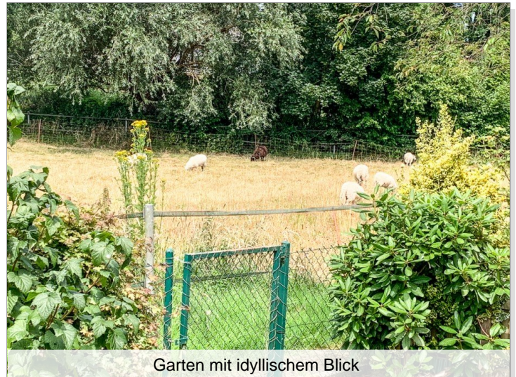
Garten mit idylischem Blick