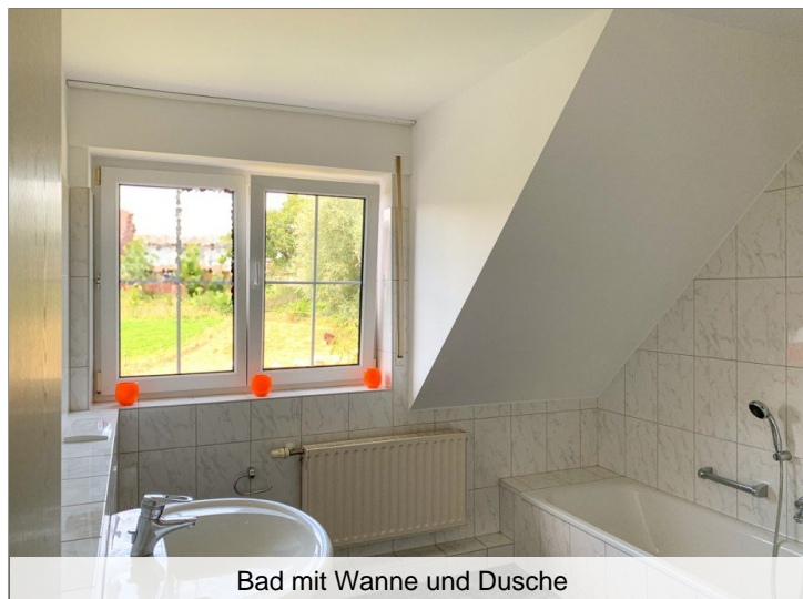
Bad mit Wanne und Dusche