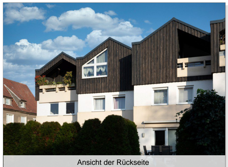
Ansicht der Rückseite