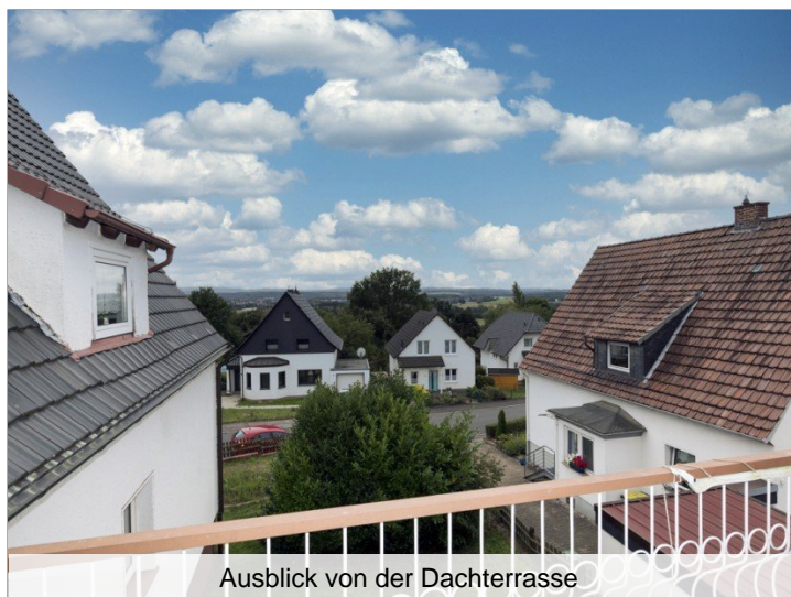
Ausblick von der Dachterrasse