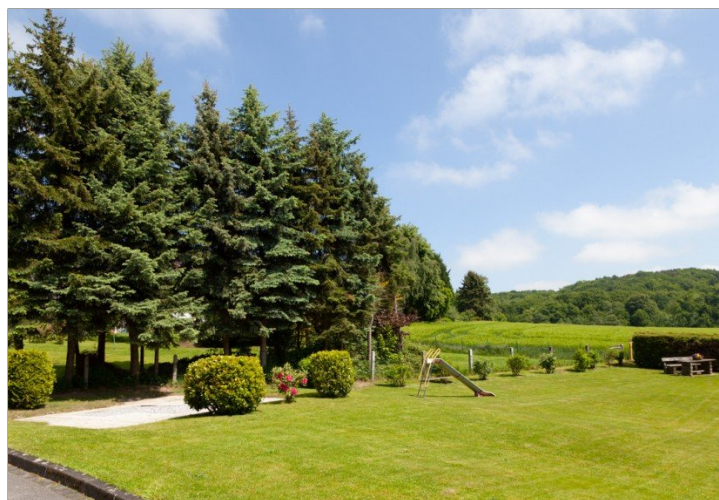
Garten im Sommer