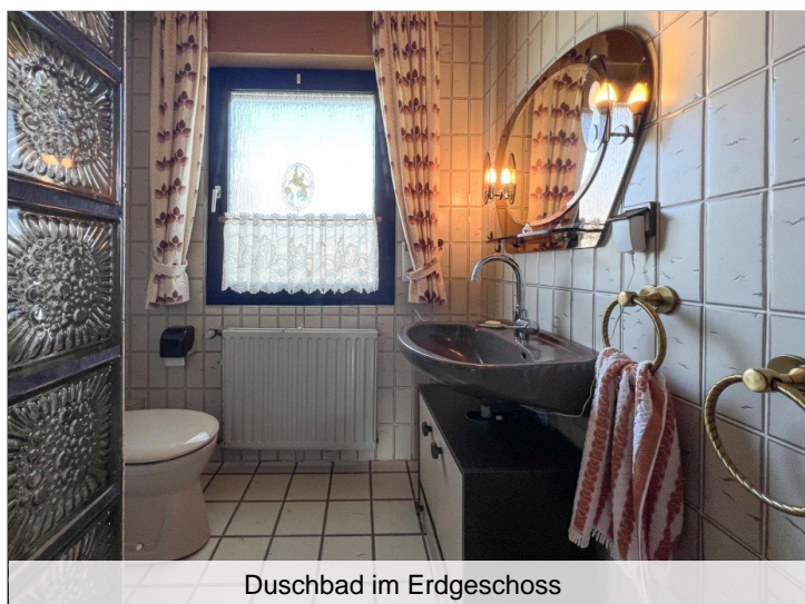
Duschbad im Erdgeschoss