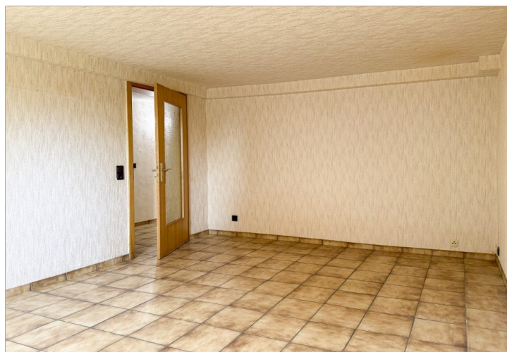
Hobbyzimmer im Sockelgeschoss