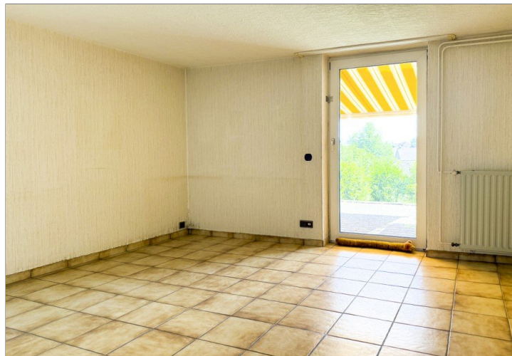
Zimmer im Sockelgeschoss