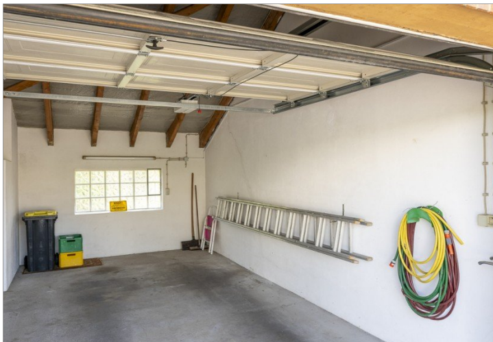
Garage mit Strom- und Wasseranschluß