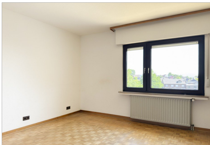
Schlafzimmer mit Parkettboden