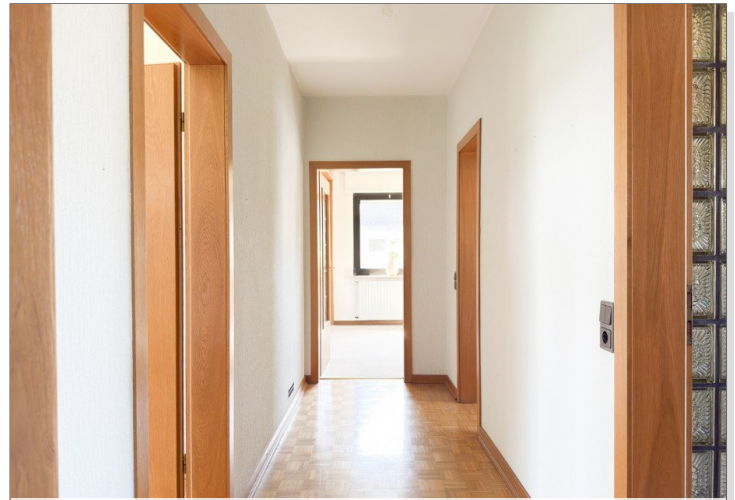
Flur im Erdgeschoss