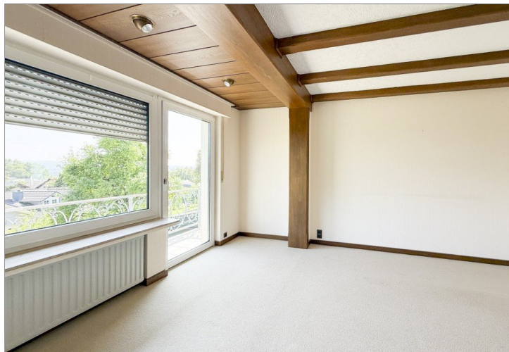
Wohnzimmer - Balkon