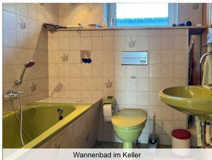
Wannenbad im Keller