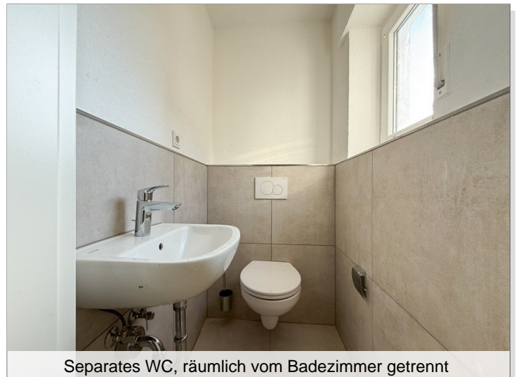
Separates WC, räumlich vom Badezimmer getrennt