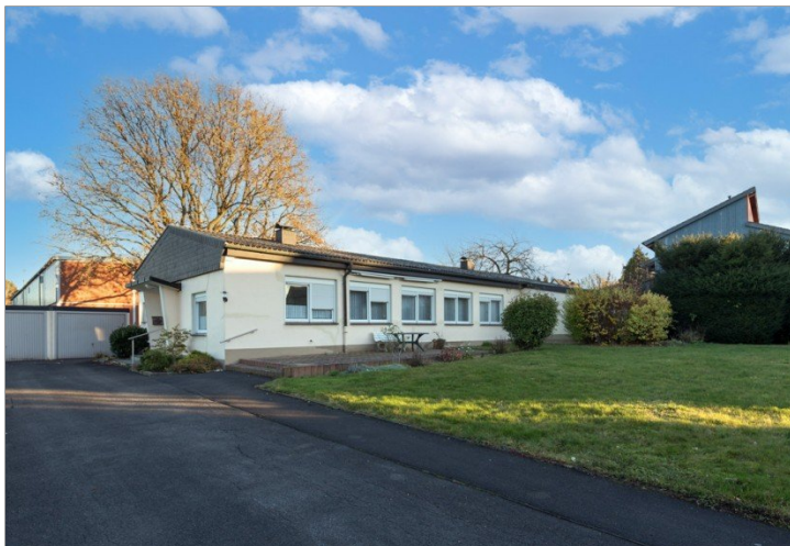
Ansicht mit Garagen