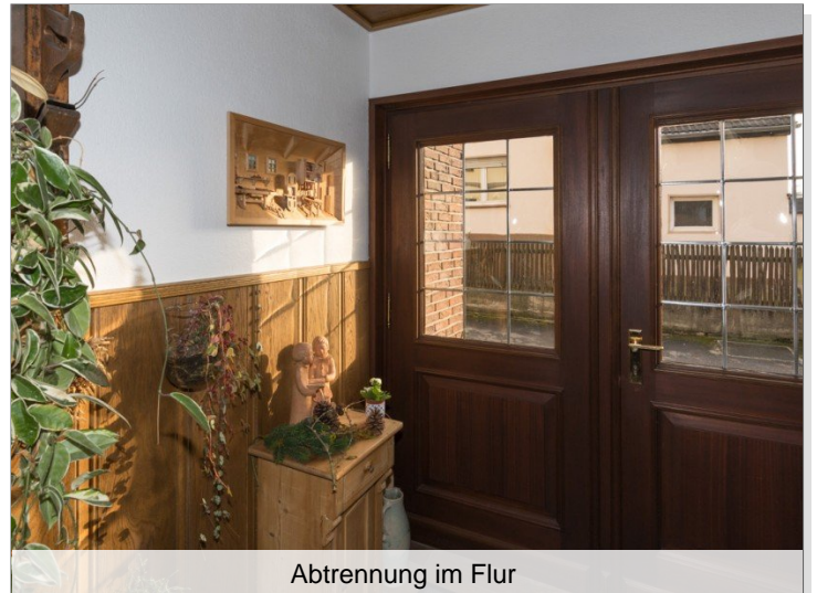
Abtrennung im Flur