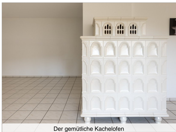
Der gemütliche Kachelofen