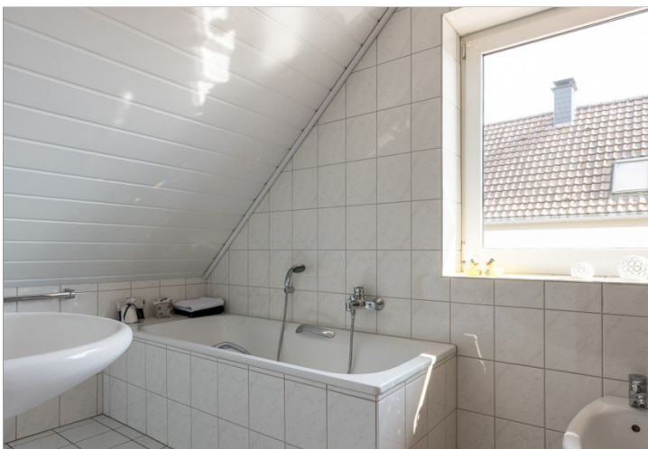
Tageslicht Bad mit Wanne und Dusche