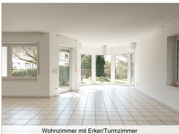
Wohnzimmer mit Erker/Turmzimmer