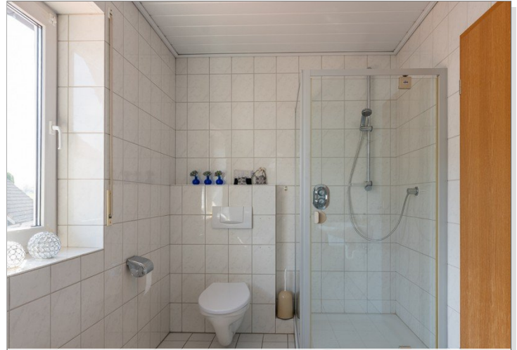
Tageslicht Bad mit Wanne und Dusche