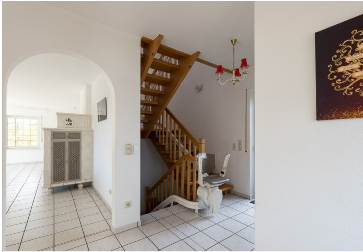
Hier geht es ins Obergeschoss...