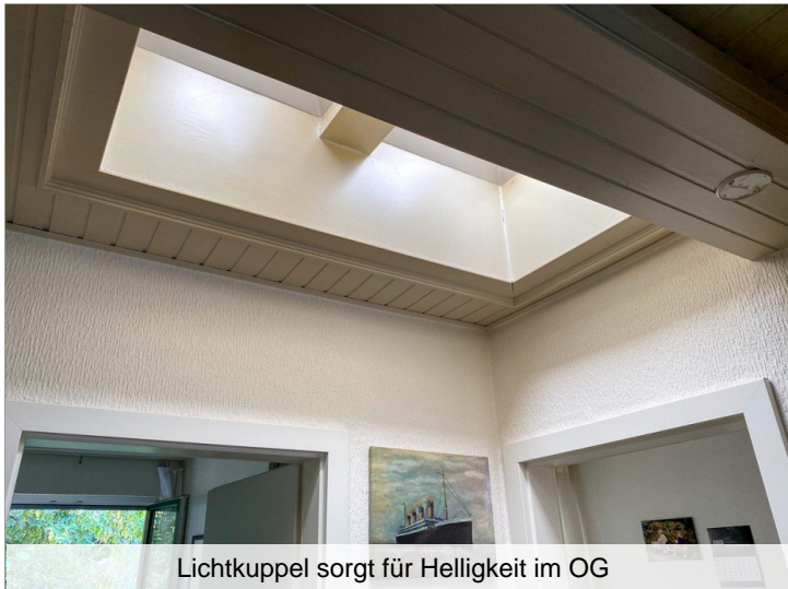
Lichtkuppel sorgt für Helligkeit im OG

Kontakt auch per WhatsApp (0176) 50 04 54 96 Ihre Daten werden nicht gespeichert