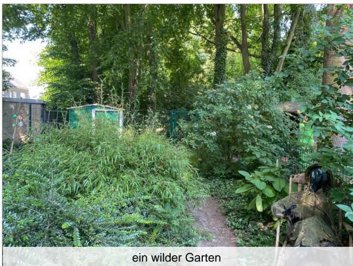
ein wilder Garten