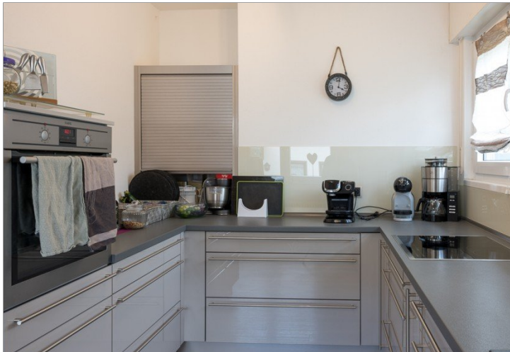
Moderne und helle Küche