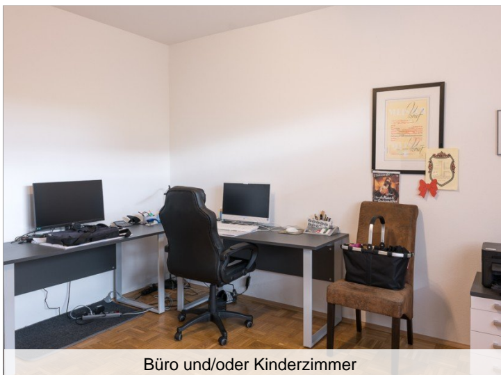
Büro und/oder Kinderzimmer