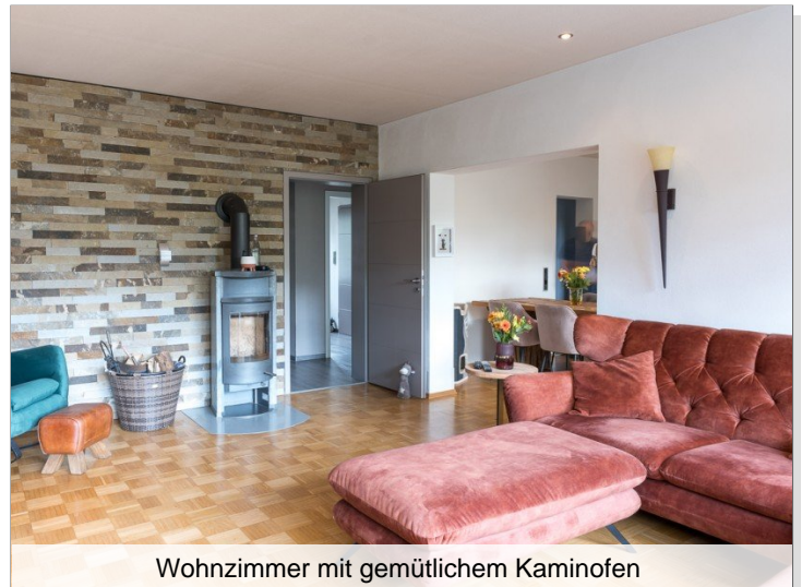
Wohnzimmer mit gemütlichem Kaminofen