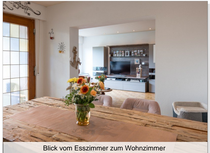
Blick vom Esszimmer zum Wohnzimmer