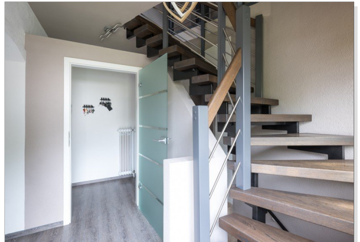
Eingangsdiele und Aufgang zum OG