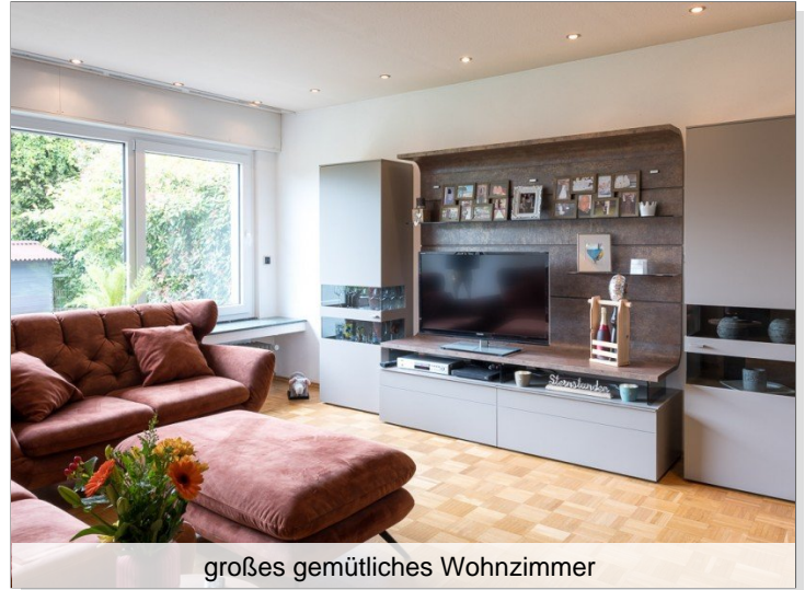
großes gemütliches Wohnzimmer