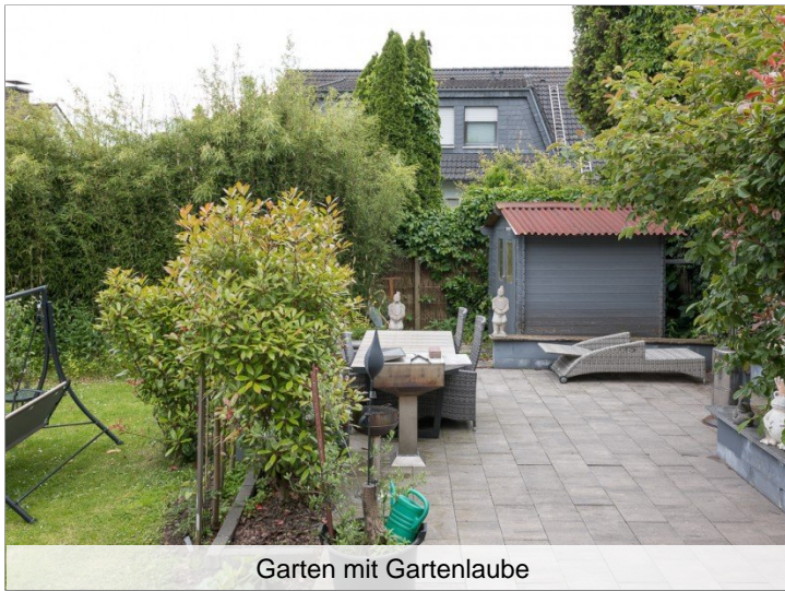
Garten mit Gartenlaube