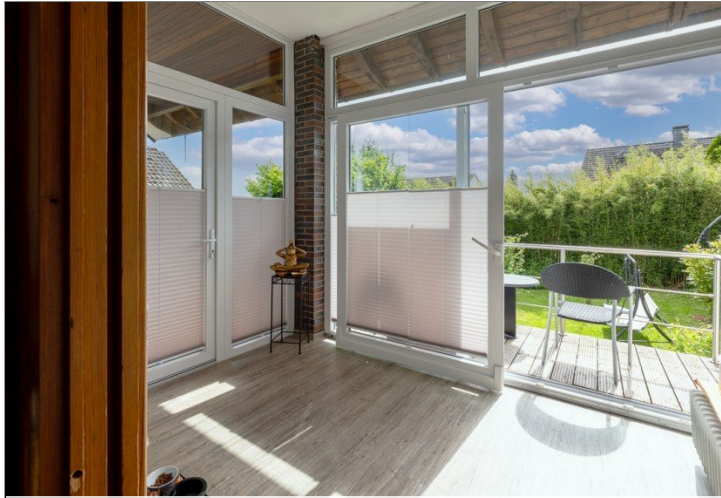
kleiner Wintergarten mit Zugang zum Garten