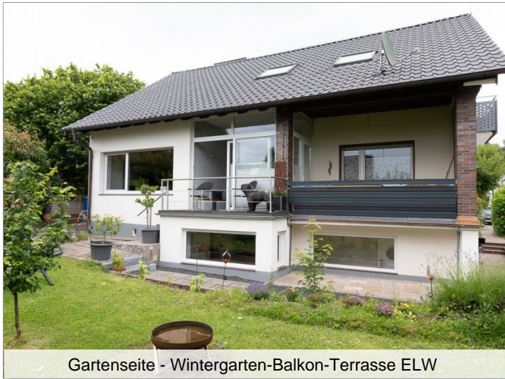
Gartenseite - Wintergarten-Balkon-Terrasse ELW