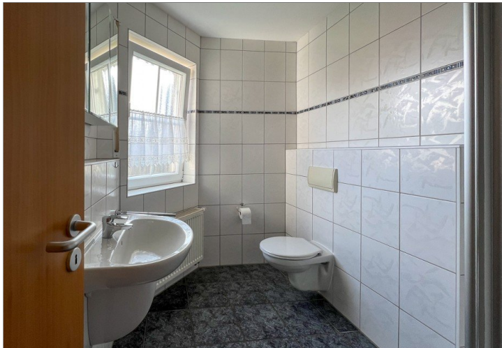
Duschbad mit Tageslicht