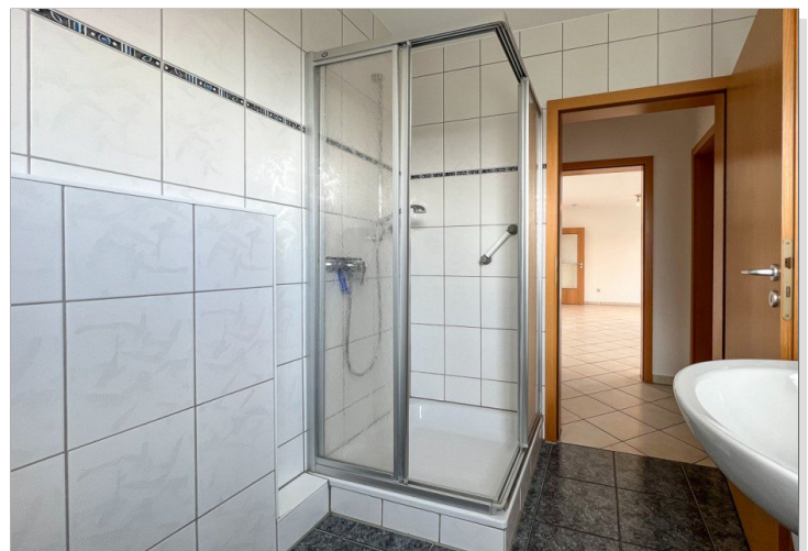
Duschbad mit Tageslicht