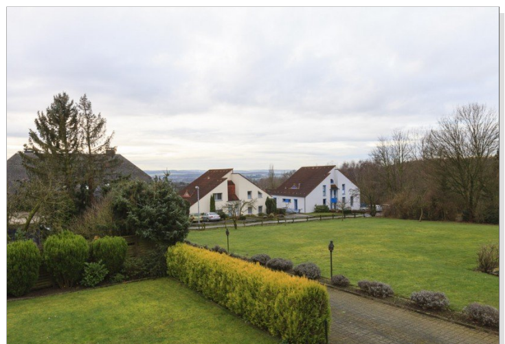
Balkon mit Blick ins Grüne