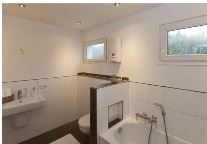
Tageslichtbad mit Wanne und Dusche