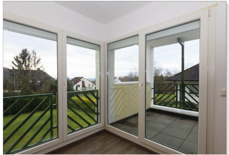
Wohnzimmer mit Zugang zum Balkon