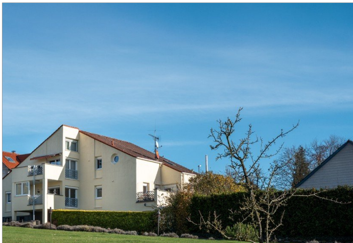
Rückseite des Wohnhauses