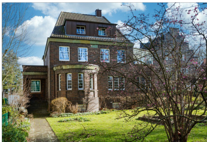
Zugang durch den Garten